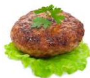
Cutlet [ˈkʌtlət] Котлета