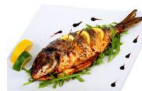
Fried fish [ˌfraɪd fɪʃ] Жареная рыба