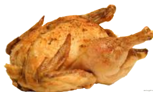
Fried chicken [ˌfraɪd ˈtʃɪkɪn] Жареная курица