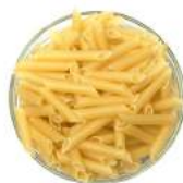
Pasta [ˈpɑ:stə] Макароны