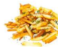
Fried Potatoes [ˌfraɪd pəˈteɪ.təʊz] Жареный картофель