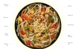
Noodles [ˈnu:dlz] Лапша