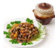
Stew [stju:] Тушеное мясо