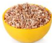
Buckwheat [ˈbʌk.wi:t] Гречневая каша