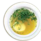
Chicken Soup [ˈtʃɪkɪn su:p] Куриный бульон