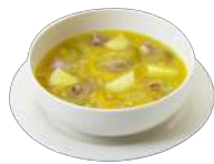
Soup [su:p] Суп